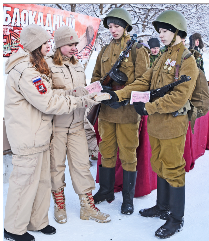
Волонтеры постарались как можно реалистичнее передать атмосферу блокады Ленинграда.

Невозможно было без слёз сжимать в руках паёк. Многие участники акции съели его