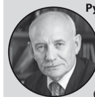
Рустэм ХАМИТОВ, Глава Республики Башкортостан:

Что касается развития человеческого потенциала, этим нужно заниматься с раннего детства. В приоритете школы нового типа, современная образовательная цифровая среда, доступное дополнительное образование для каждого ребенка, развитие талантов.