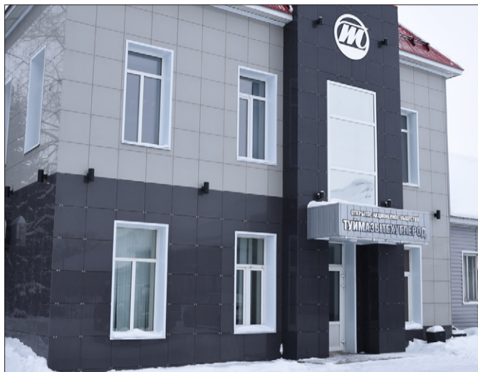
Предприятие выпускает гранулированный и порошковый техуглерод, до 40% которого идёт на экспорт, остальное реализуется в России.