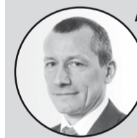
Андрей ШАРОНОВ, президент Московской школы управления «Сколково»:

То, что мы сегодня делаем — это шаги в нужном направлении. Мы начинаем мыслить, думать, включаем головы. Мы начинаем самостоятельно генерировать идеи. Вижу, что нас — единомышленников такого проектного, системного подхода к развитию всего нашего общества, экономики, аграрного сектора, малого бизнеса, государственного управления, образования, науки, культуры, здравоохранения — все больше и больше. Это замечательно. Но и общество в целом должно работать, двигать себя вперед. Все, что происходит на территории Республики Башкортостан, зависит только от нас с вами.